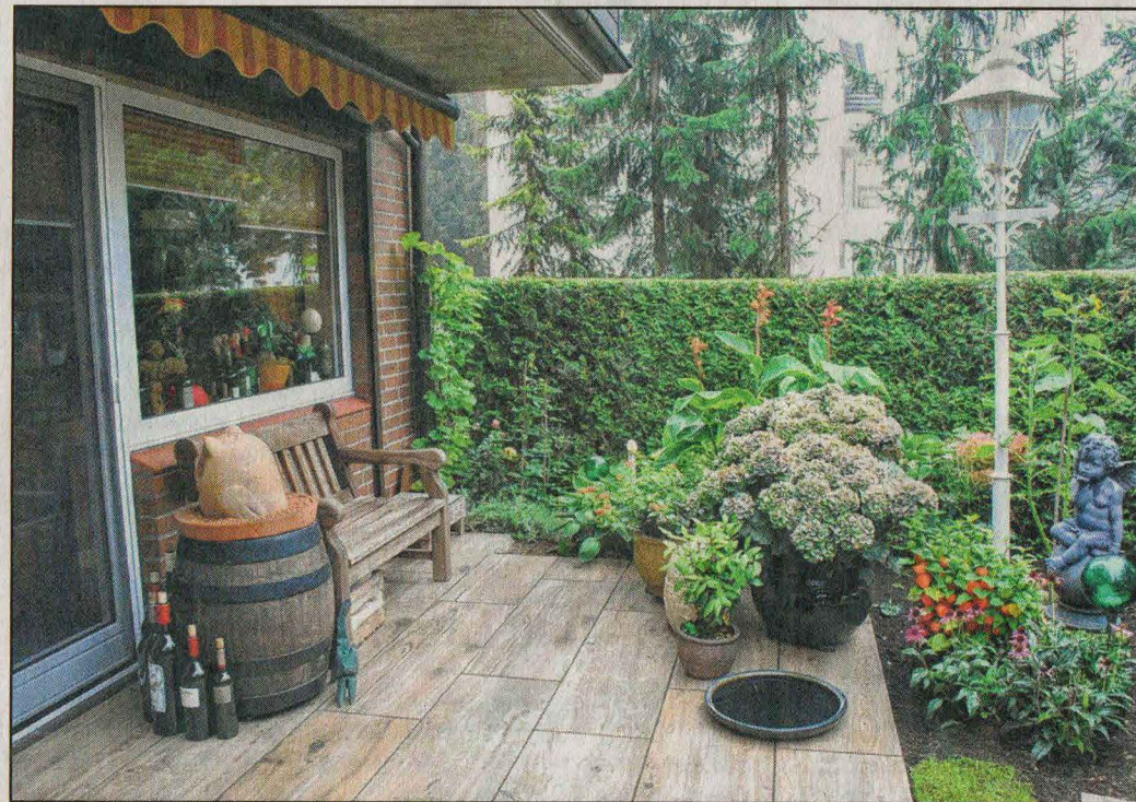
Gartenidylle pur mit den Keramikfliesen in Holzoptik.

Danach kommen Splitt und Trasszement oben drauf sowie eine Haftschlämme. Darin werden die Fliesen im Frischbettverfahren verlegt. „Durch diese Art Unterboden haben wir eine absolute hohe Frostsicherheit. Zudem sind die Ke-